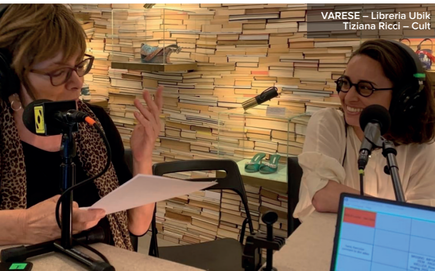
VARESE – Libreria Ubik Tiziana Ricci – Cult